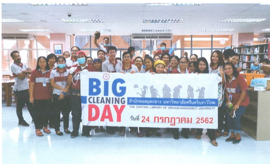
ณ พื้นที่ชั้น 6 สำนักหอสมุดกลาง