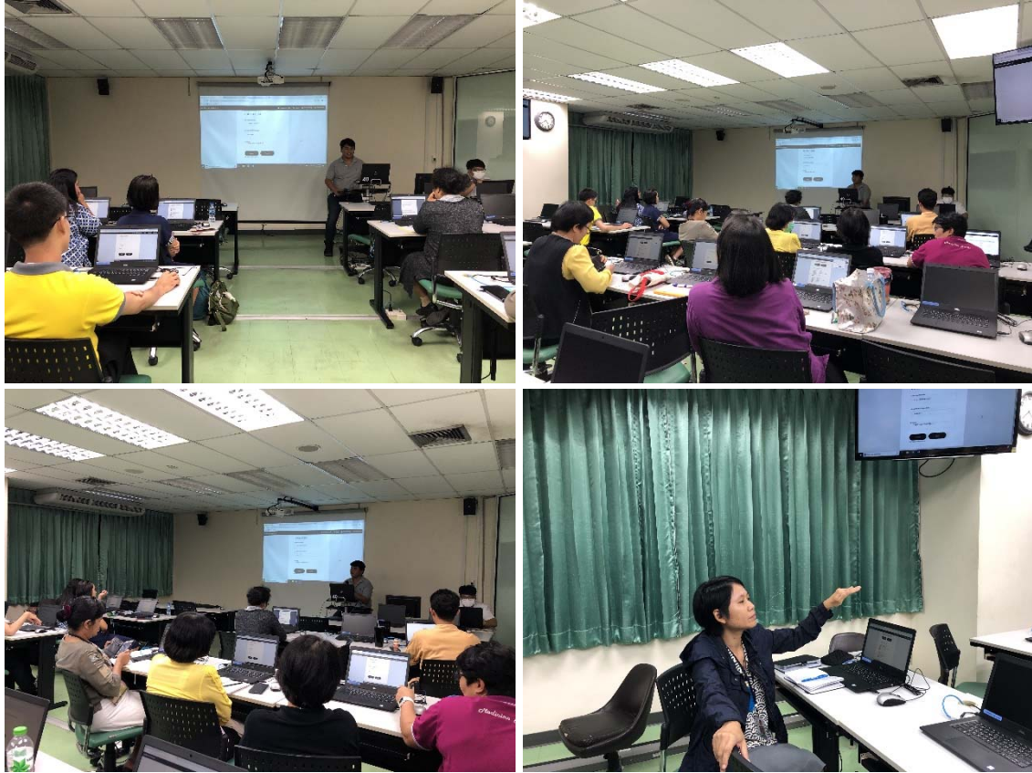
ภาพภาพกิจกรรม “เทคนิคการวิเคราะห์ ประเมิน และสรุปผลการดำเนินโครงการของสำนักหอสมุดกลาง” ในวันที่ 11 กรกฎาคม 2562 ณ ห้องประชุม 702 ชั้น 7 สำนักหอสมุดกลาง