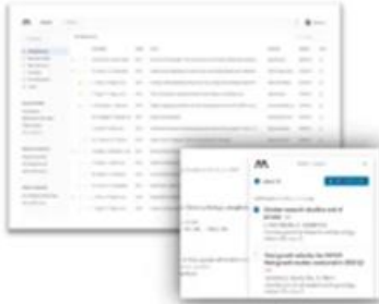
Web and Web Importer

Mendeley is available on many platforms and powerful when used with databases and word processing program