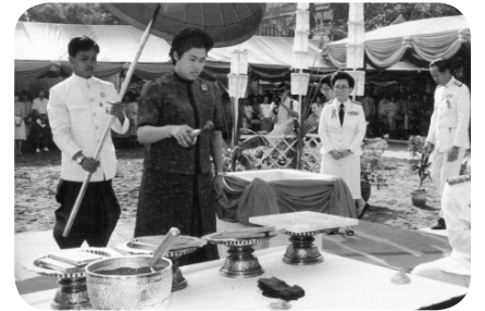
สมเด็จพระเทพรัตนราชสุดาฯ เสด็จพระราชดำเนินมาทรงวางศิลาฤกษ์ “อาคารสมเด็จพระเทพรัตนราชสุดาฯ” เมื่อวันที่ 9 กุมภาพันธ์ 2530

มิถุนายน พ.ศ. 2539 ต่อมาได้รับงบประมาณในการสร้างห้องสมุดหลังใหม่และเปิดให้บริการในเดือนมกราคม พ.ศ. 2541 เป็นต้นมา สำนักหอสมุดกลางใช้ระบบ ห้องสมุดอัตโนมัติและระบบการสืบค้น (SWU Discovery) เพื่อการจัดเก็บและสืบค้นทรัพยากรสารสนเทศร่วมกันภายในเครือข่ายห้องสมุดภายใต้สังกัดมหาวิทยาลัยศรีนครินทรวิโรฒ ได้แก่ ห้องสมุดประสานมิตร ห้องสมุดองครักษ์ ห้องสมุดคณะแพทยศาสตร์องครักษ์ จังหวัดนครนายก ห้องสมุดศูนย์การแพทย์ปัญญานันทภิกขุฯ จังหวัดนนทบุรี และห้องสมุดวิทยาลัยโพธิวิชชาลัย จังหวัดสระแก้ว