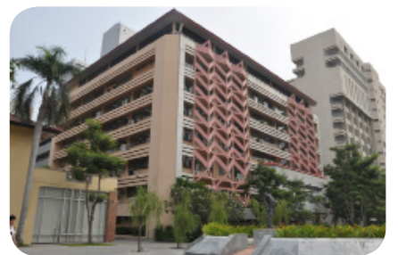
สำนักหอสมุดกลาง ปี พ.ศ. 2558